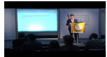
Videomitschnitt der Session „Rechtliche Aspekte des Open Access - Open-Access-Tage Hamburg 2013“ https://youtu.be/Dmlh_orxRX8

Elena Di Rosa, Rechteklärung für OA-Zweitveröffentlichungen – das Serviceangebot der SLUB Dresden (Vortragsfolien) , 7. OA-Tage 2013 in Hamburg